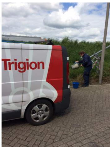
Een beeld van de schoonmaakwerkzaamheden aan de camera's van afgelopen week, gemakkelijk uit te voeren met behulp van een kantelbare mast.